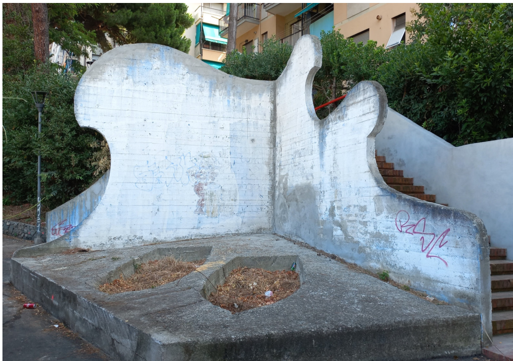
Muri del parco pre intervento