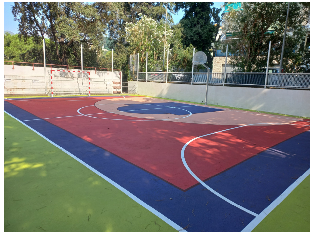
Campo post intervento

Parco pubblico delle Sorgenti Sulfuree a Prà: valorizzazione del sistema delle Creuze e riqualificazione del parco - Int. 6