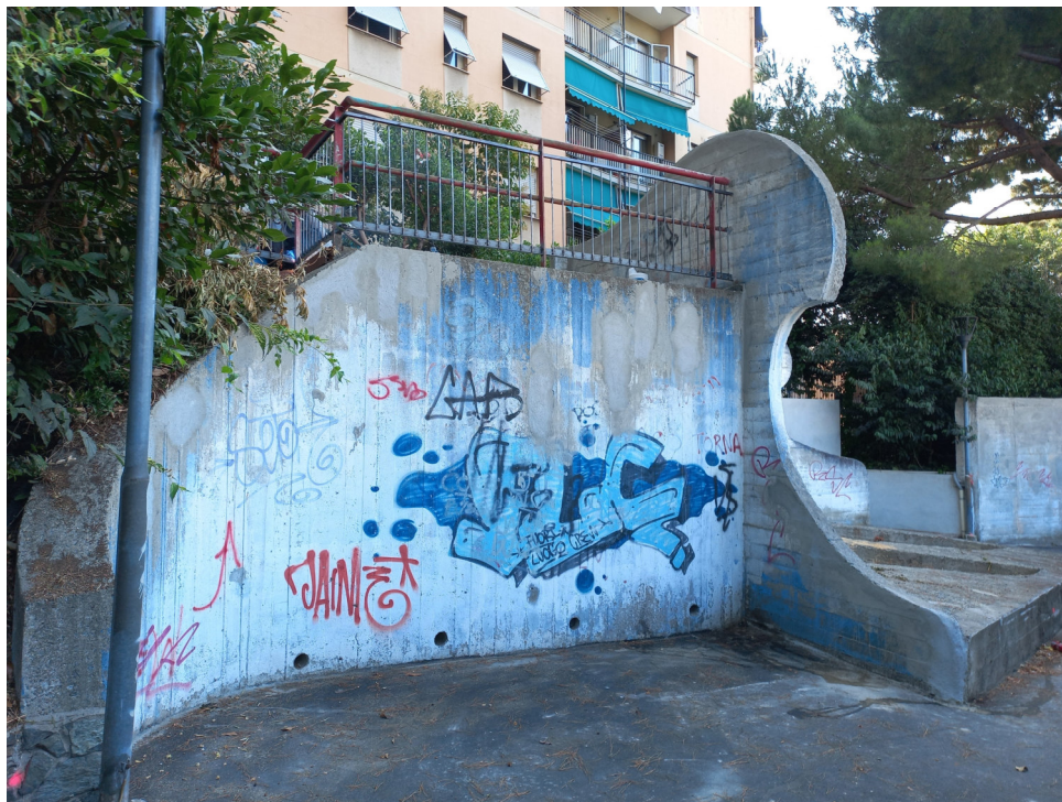
Muri del parco pre intervento