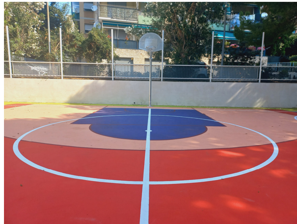
Campo da gioco

Parco pubblico delle Sorgenti Sulfuree a Prà: valorizzazione del sistema delle Creuze e riqualificazione del parco - Int. 6