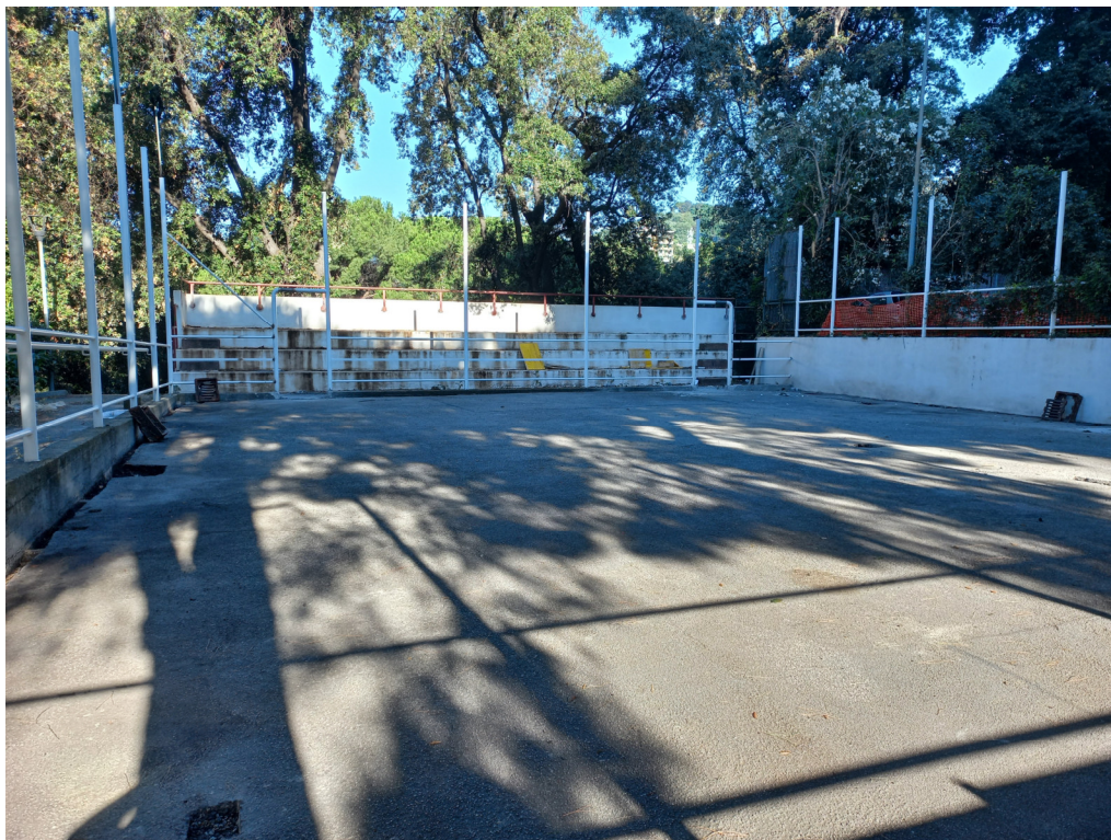
Campo pre intervento