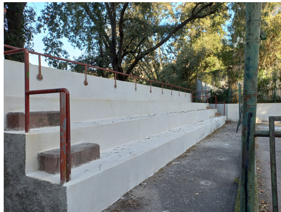
Gradonata Post intervento

Parco pubblico delle Sorgenti Sulfuree a Prà: valorizzazione del sistema delle Creuze e riqualificazione del parco - Int. 6