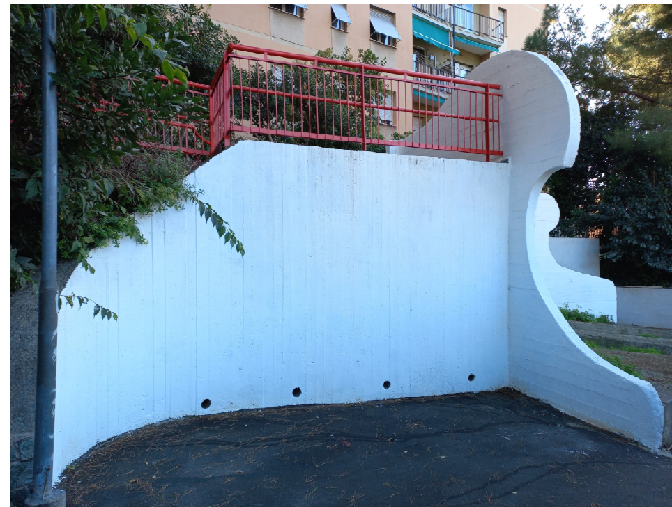
Muri del parco post intervento