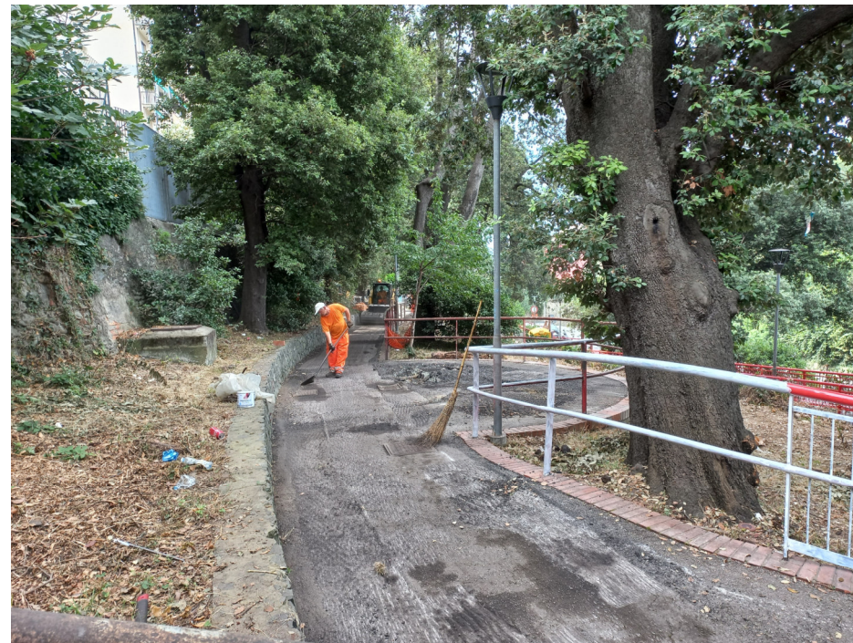
Percorsi del parco durante le lavorazioni Sistemazione asfalto, ringhiere e muretti

Parco pubblico delle Sorgenti Sulfuree a Prà: valorizzazione del sistema delle Creuze e riqualificazione del parco - Int. 6