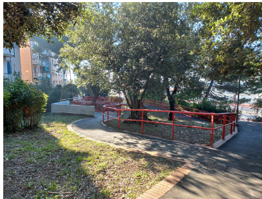
Percorsi del parco post intervento Sistemazione asfalto, ringhiere e muretti

Parco pubblico delle Sorgenti Sulfuree a Prà: valorizzazione del sistema delle Creuze e riqualificazione del parco - Int. 6