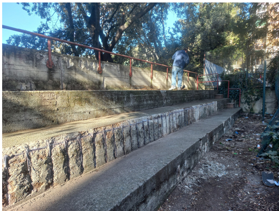
Gradonata Pre intervento