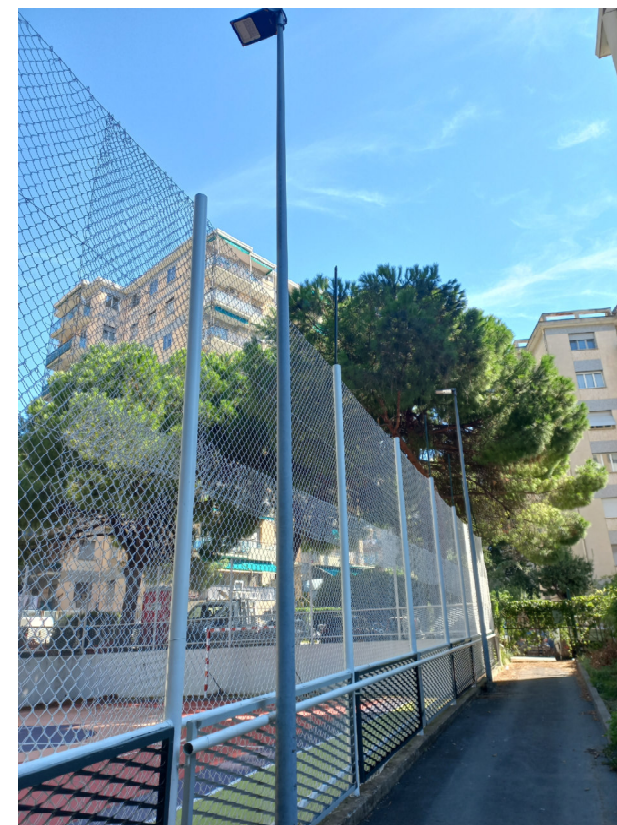
Campo da gioco e reti di delimitazione

Parco pubblico delle Sorgenti Sulfuree a Prà: valorizzazione del sistema delle Creuze e riqualificazione del parco - Int. 6