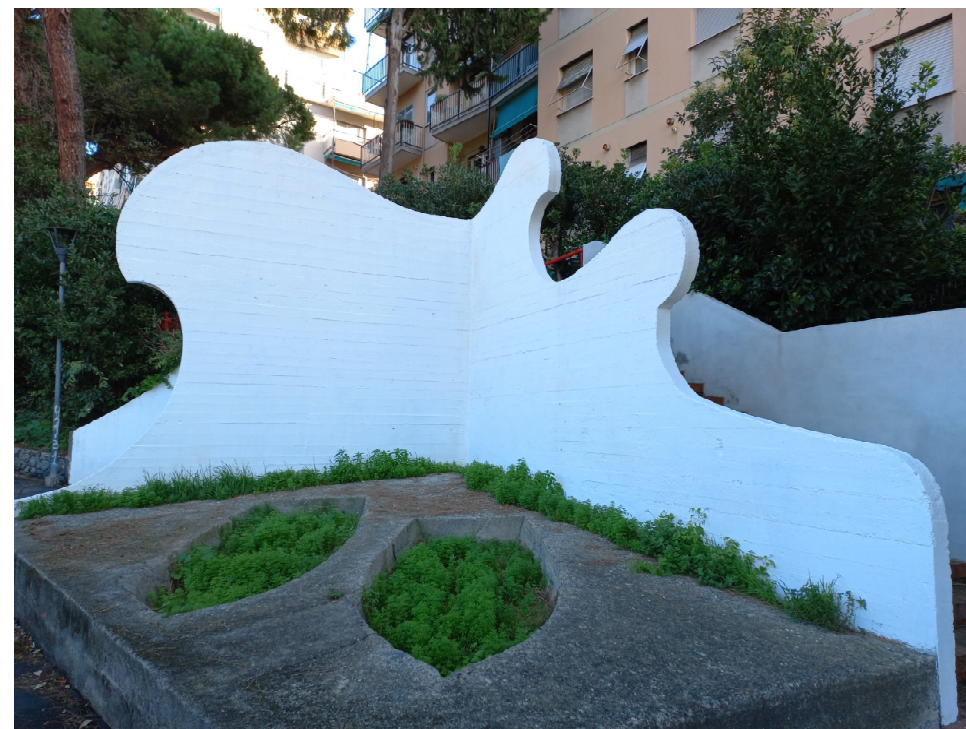
Muri del parco post intervento